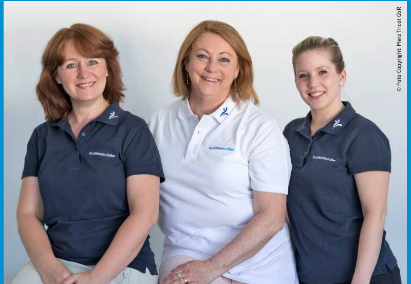
Kompetent, freundlich und immer für Sie da - unsere drei Expertinnen im Bereich der Lymph- und Brustversorgung in der Leimenstraße.

Die Grundlage für eine optimale Versorgung bilden sowohl fachkundige Mitarbeiter, hochwertige Produkte als auch eine angenehme Atmosphäre, in der sich die Kunden wohlfühlen. Das neugestaltete Sanitätshaus in der Nordstraße in Hanau vereint diese drei Aspekte zu einem Komplettpaket für mehr Gesundheit und Lebensqualität. Wie auch schon